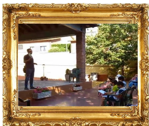
Parlem de Llibres! Biblioteca de Roda de Ter, Juny (2021)