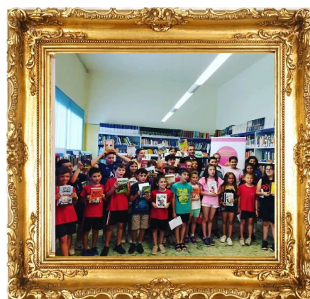
Parlem de Llibres amb Gelats Biblioteca de Castellans, Juny (2023)