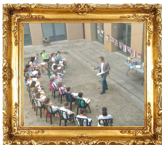
Parlem de Llibres! Biblioteca de Balaguer, Maig (2022)