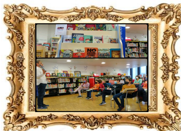
Parlem de Llibres! Biblioteca del Vendrell, Abril (2022)