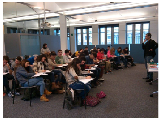
Taller d'Espectura Jove. Caixaforum, Barcelona (2014)