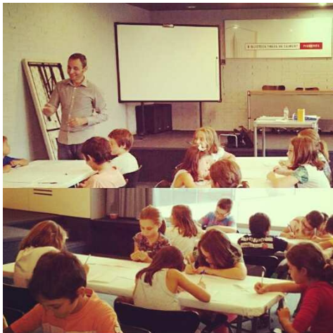
Taller Escriure per Riure. Biblioteca Fages de Climent, Figueres (2015)