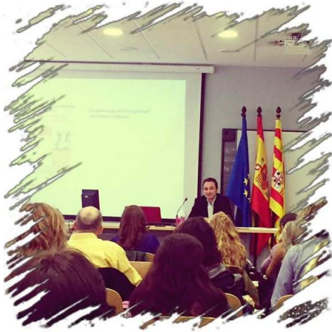
Espectura Creativa a l'Aula. CAREI, Saragossa (2015)