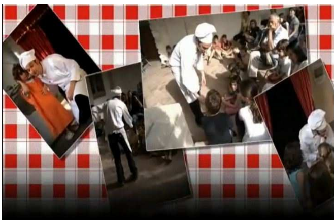
Festival en Veu Alta