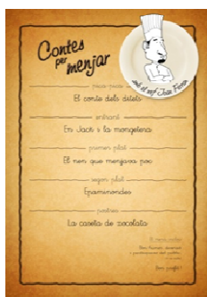
Cartell de l'espectacle

MATERIAL PROMOCIONAL DISPONIBLE A WWW.JOANBOHER.CAT :