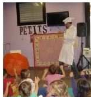
Biblioteca del Pont de Vilomara