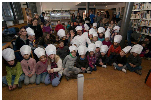
Biblioteca de Caldes de Malavella