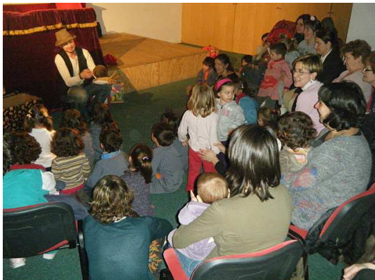
Centre Cultural Sala Gala de Cassà de la Selva