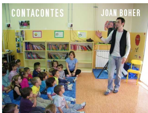
CEIP Miquel Martí i Pol de Barberà del Vallès