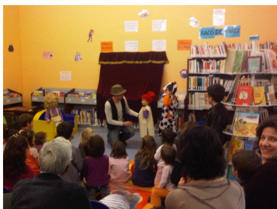
Biblioteca Montserrat Roig de Martorelles