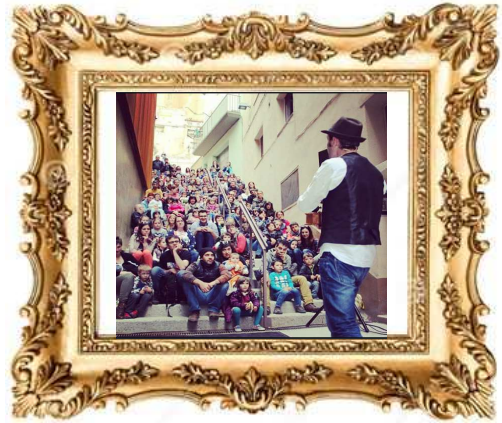
Festival Encontats de Balaguer, 2016