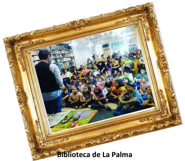
Biblioteca de La Palma De Cervelló, 2017