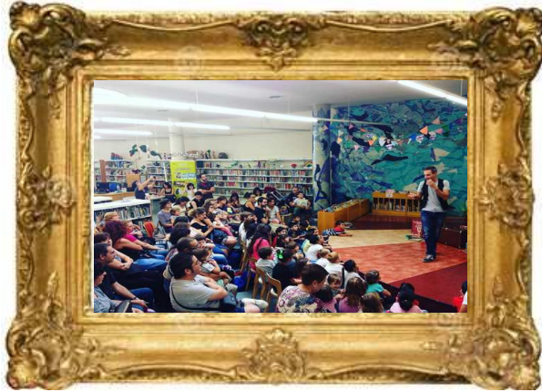
Biblioteca Central de Santa Coloma de Gramenet, 2016