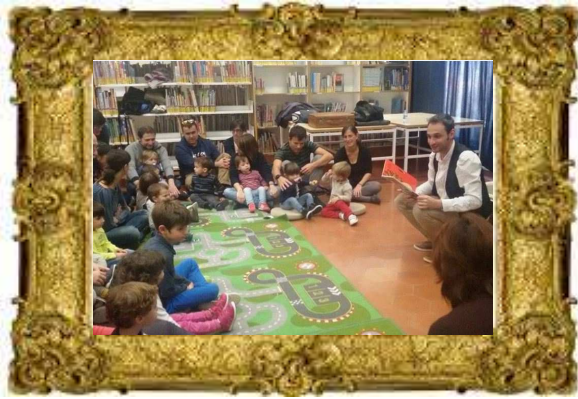
Biblioteca de Vilafranca del Penedès, 2015