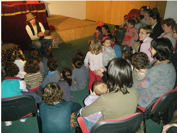
Centre Cultural Sala Gala de Cassà de la Selva