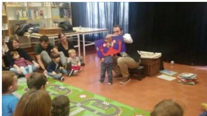
Biblioteca Torras i Bages de Vilafranca del Penedès