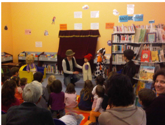
Biblioteca Montserrat Roig de Martorelles