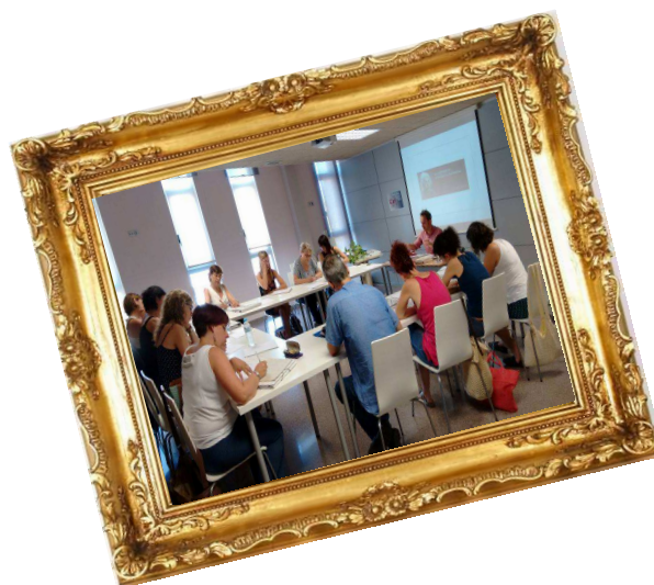
Curs “Espectura Creativa a l’Aula”. Escola d’estiu Moviment de Renovació Pedagògica de l’Alt Empordà, Figueres, Juliol (2016)