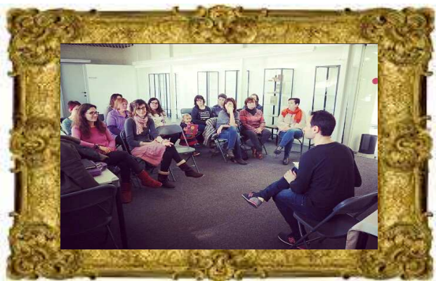
Taller “L’Art d’Explicar Contes”. Biblioteca de La Seu d’Urgell, Novembre(2016)