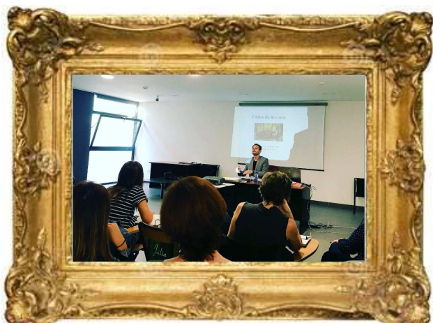
Curs “Clubs de Lectura”. Servei Biblioteques Terres de l'Ebre, Octubre(2017)