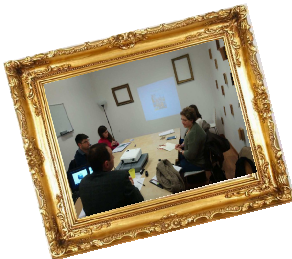
Curs “Eines de Dinamització Lectora” Laboratori de Lletres, Barcelona (2019)