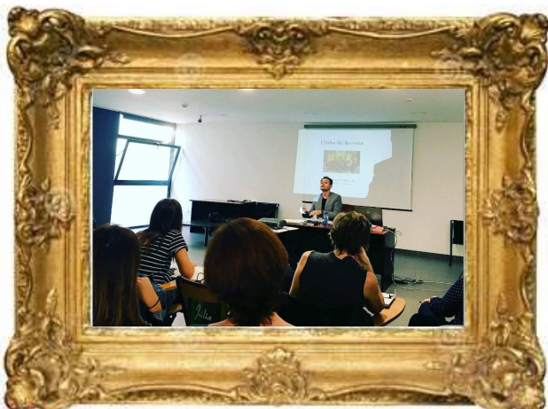
Curs “Clubs de Lectura”. Servei Biblioteques Terres de l’Ebre, Octubre (2017)