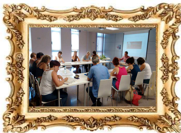
Curs “Escriptura Creativa a l’Aula” Escola d’estiu del Moviment de Renovació Pedagògica de l’Alt Empordà, Figueres (2016)