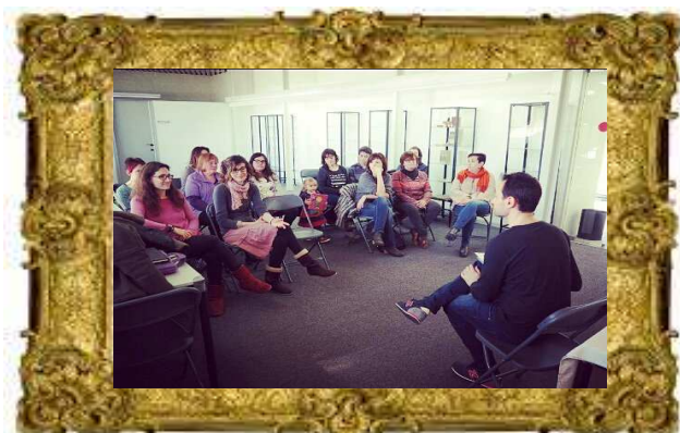
Taller “L’Art d’Explicar Contes”. Biblioteca de La Seu d’Urgell, Novembre(2016)