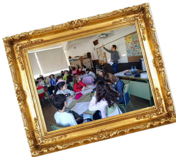
Taller “Escriure per Riure”, CEIP Puig d’Arques de Cassà de la Selva, Abril (2018)