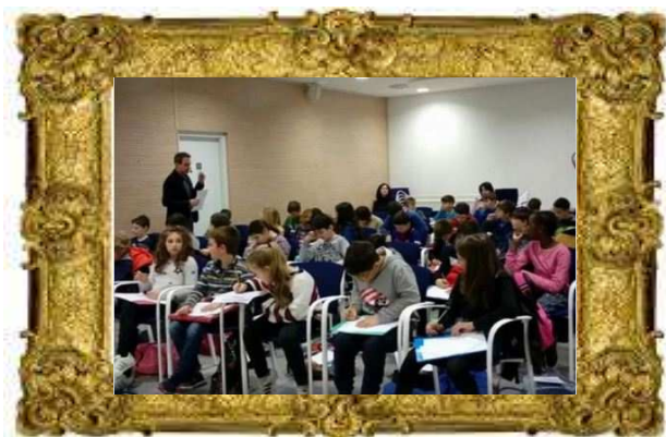
Taller “Escriure per Riure”, Biblioteca de Santa Susanna, Març (2018)