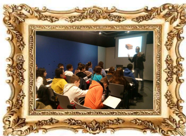
Taller “Esriptura Jove”, Caixaforum de Barcelona, Gener (2017)