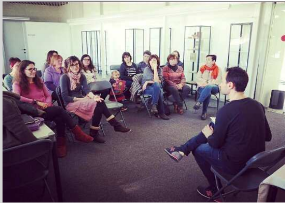
L'Art d'Explicar Contes, a la biblioteca de La Seu d'Urgell (2017)