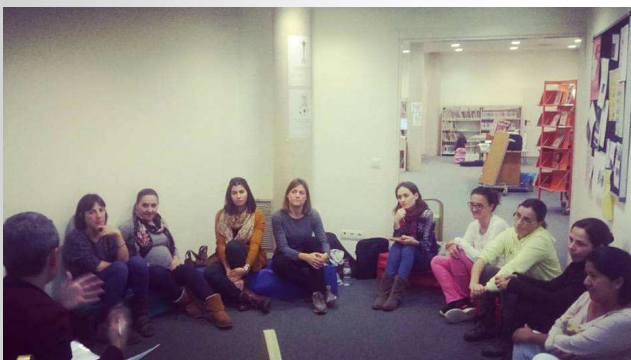
L'Hora dels Pares (jornada de formació) a Castelló d'Empúries(2016)