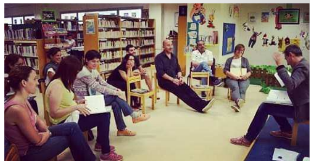
L'Hora dels Pares (jornada de formació) a Montbrió del Camp (2016)