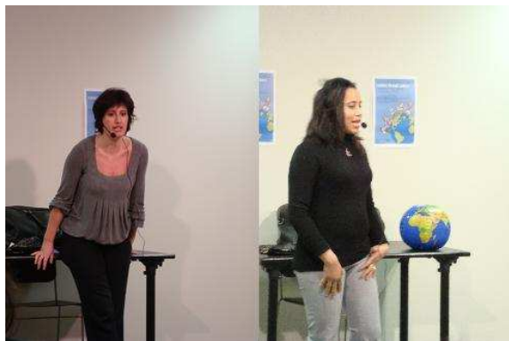
Contes de tots Colors, pares de diferents nacionalitats, Barcelona (2010)