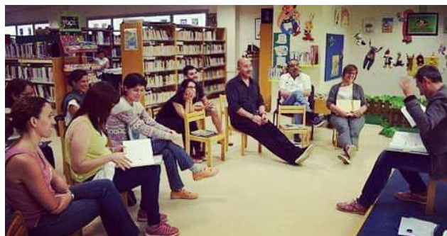
L'Hora dels Pares (jornada de formació) a Montbrió del Camp (2016)