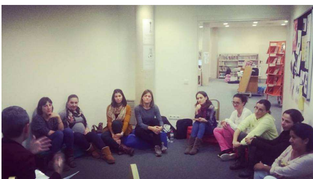
L'Hora dels Pares (jornada de formació) a Cas- telló d'Empúries(2016)