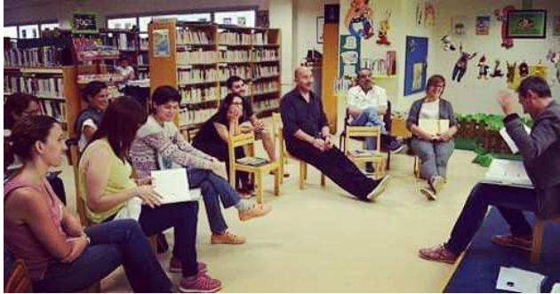
L'Hora dels Pares (formació) a Montbrí del Camp (2016)