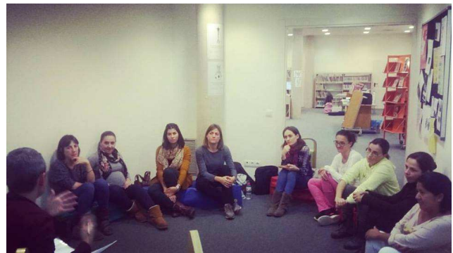
L'Hora dels Pares (formació) a Castelló d'Empúries (2016)